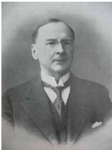
Eugeniusz Waśkowski – fotografia z lat 20-tych XX w.

Pomimo powyższego próba dokładnej rekonstrukcji życiorysu Eugeniusza Waśkowskiego stale napotyka liczne zacięte momenty. Jedne okresy pozostają niemal nieznane, inne są przedmiotem domysłów. Niektóre z kart życia Waśkowskiego udało się odczytać w trakcie pisania artykułu w 2012 r. pt. Eugeniusz Waśkowski (1866-1942). W siedemdziesięciolecie śmierci wybitnego uczonego i adwokata . Inne dopiero w trakcie pisania niniejszego tekstu, ale wiele pozostaje nieodczytane.